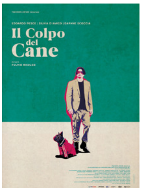
Regie Fulvio Risuleo Italien 2019 93 Minuten

Phaim, ein 22-jähriger Muslim mit bengalischen Wurzeln, lebt mit seiner Familie in dem multiethnischen Stadtteil Torpignattara in Rom. Sein Geld verdient er als Aufseher in einem Museum, nebenbei ist er Kopf einer Rockband. Während eines Konzerts lernt er Asia kennen, eine junge Frau aus einer Künstlerfamilie, die komplett anders tickt: purer Instinkt, keine Regeln. Die beiden verlieben sich – und Phaim stürzt in ein Dilemma: Eigentlich müsste er eine bengalische Frau heiraten. Und wie soll er seine Beziehung mit dem unumstößlichen Gesetz des Islam unter einen Hut bringen: keinen Sex vor der Ehe? Ein Clash der Kulturen als charmante, autobiografische Komödie. Der junge bengalisch-stämmige Regisseur spielt sich und seine Geschichte selbst, mit Witz, Selbstironie und einem gehörigen Schuss Romantik.