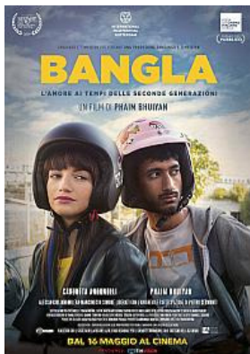
Regie Phaim Bhuiyan Italien 2019 87 Minuten