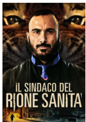
Regie Mario Martone Italien 2019 115 Minuten