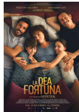
Regie Ferzan Özpetek Italien 2019 118 Minuten